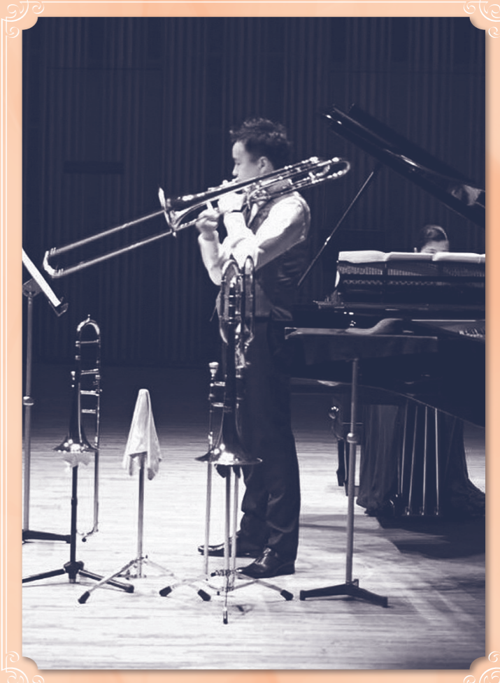
第1429回札幌市民劇場 中野耕太郎 トロンボーンリサイタル 2018