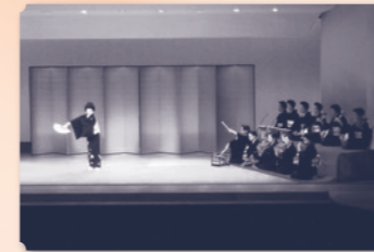
第1443回札幌市民劇場 第七回長唄百和会演奏会