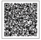
QRコードもご利用いただけます

6月20日(水)受付開始。お電話・メール・WEBにてお申し込みできます！ 教文演劇フェスティバル実行委員会事務局 TEL: 011-271-5822 【電話受付時間 10:00～17:00】第2第4月曜日 MAIL: en_fes_mail@yahoo.co.jp WEB: http://kyobun-enfes.com